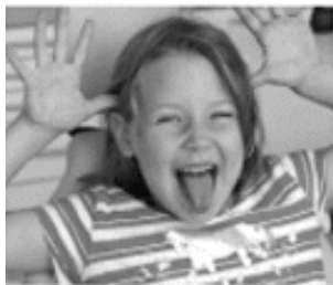
[ PRIVATHAFTPFLICHT ]