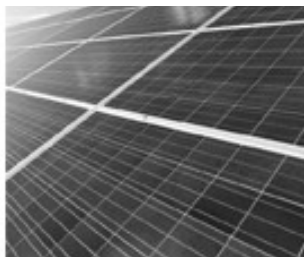
[ PHOTOVOLTAIK ]