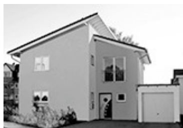
[ WOHNGEBÄUDE ]