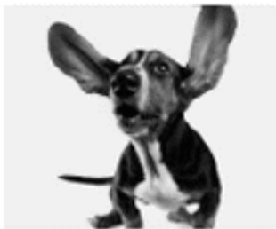
[ TIERHAFTPFLICHT ]