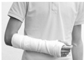
[ UNFALL ]