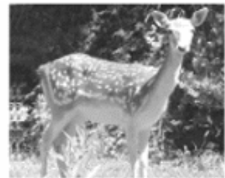
[ JAGDHAFTPFLICHT ]