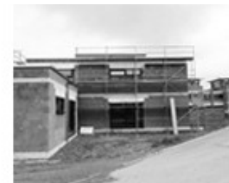
[ KAUTION ]