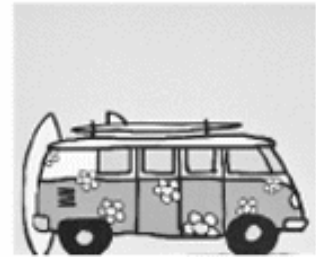
[ WOHNMOBIL ]