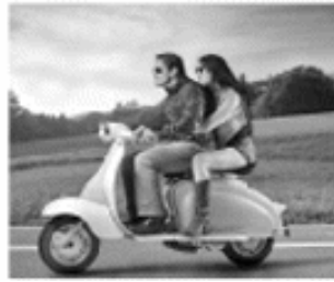
[ KRAD ] [ TRIKE ] [ QUAD ]