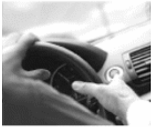
[ AUTO ]

Im Bereich KFZ-Versicherung wählen Sie bitte unter "Auto", "Krad/Trike/Quad" und "Wohnmobil" und Sie erhalten sofort nach Absendung des Antrages Ihre persönliche eVB-Nummer!