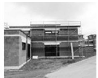
[ BAULEISTUNG ]